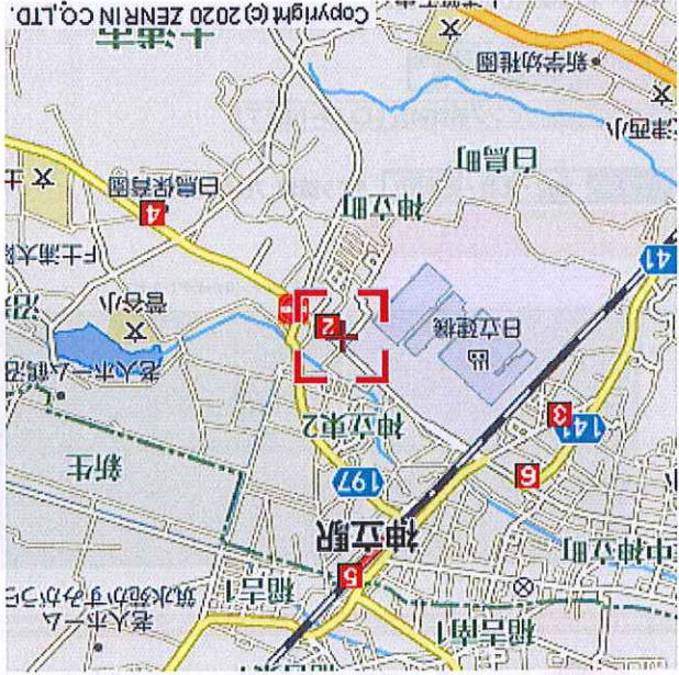
縮小図 + 現地